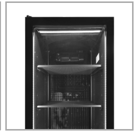
3 cordons LED, verticaux et horizontaux